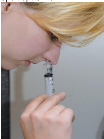
Diep inademen en dan de adem inhouden.